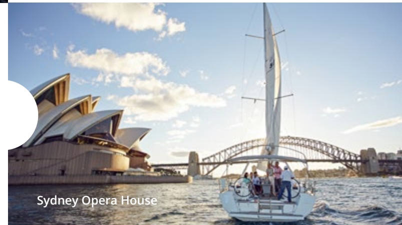
Sydney Opera House

Красота наших городов и национальные достопримечательности Посетите исторические места, памятники и сооружения