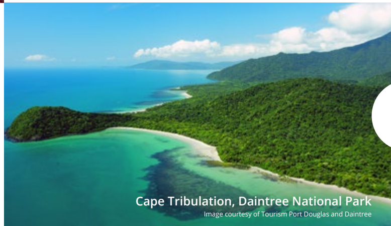
Cape Tribulation, Daintree National Park

Национальные парки и заповедники Наш разнообразный природный мир, зеркальные водопады и прогулки по подвесным дорожкам над вершинами деревьев заставят вас влюбиться в красоту нашего красочного континента