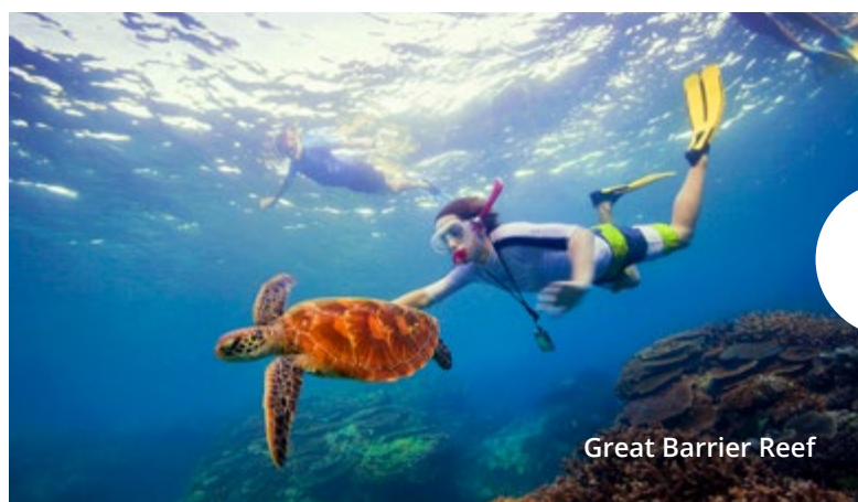
Great Barrier Reef