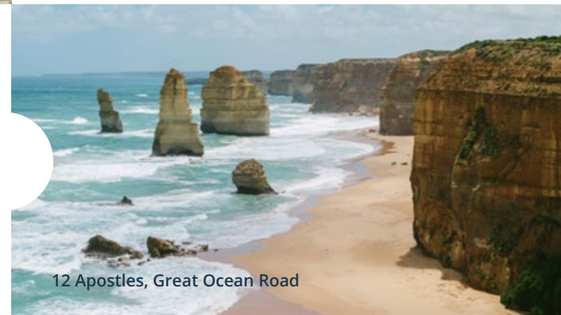
12 Apostles, Great Ocean Road

Захватывающие живописные океанские дороги Отправьтесь в путешествие по побережьям океана где вы столкнётесь с нетронутой природой первозданных пляжей