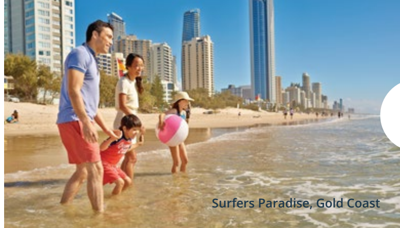
Surfers Paradise, Gold Coast