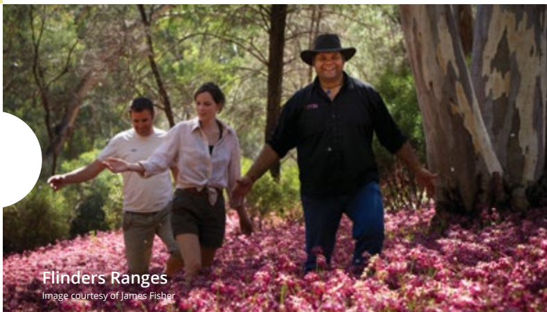
Flinders Ranges

Вековые леса и сказочный растительный мир Уникальная флора и фауна вас заманит своей неотразимой красотой