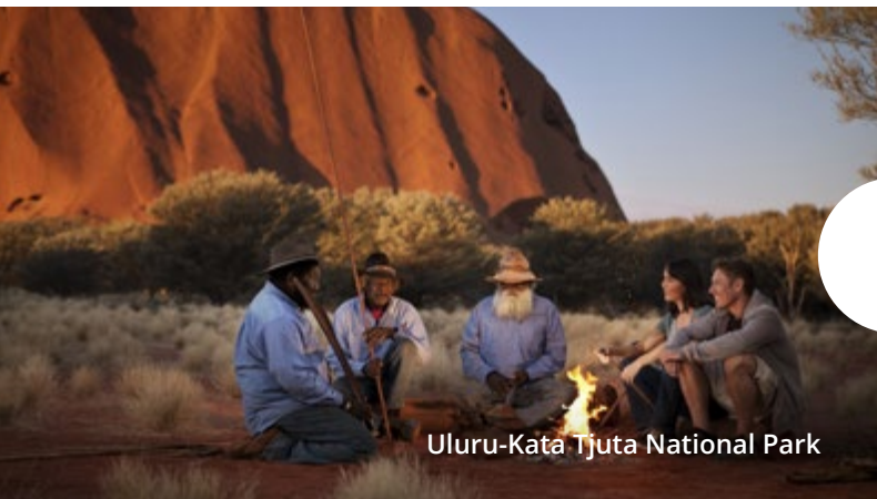
Uluru-Kata Tjuta National Park

Необъятный и цветной центр материка Окунитесь в самую глубь Австралии где безграничные красные долины и завораживающие пейзажи